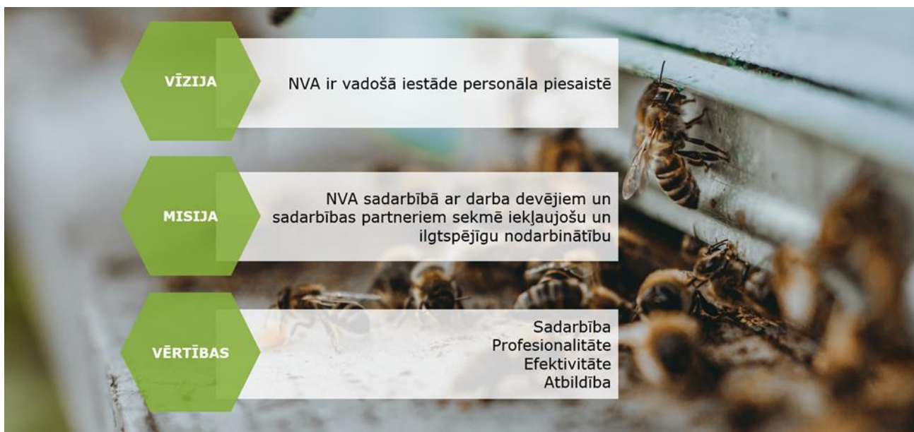
1.attēls. NVA stratēģijā 2021. – 2023. gadam noteiktā misija, vīzija, vērtības.

NVA darbības stratēģijā 2021.–2023. gadam noteiktajai misijai, vīzijai un vērtībām pakļauti izvirzītie uzdevumi, kā arī NVA darbinieku ikdiena, veicot savus pienākumus darbā ar klientiem, un, sadarbojoties ar kolēģiem (sk. 1. attēls).